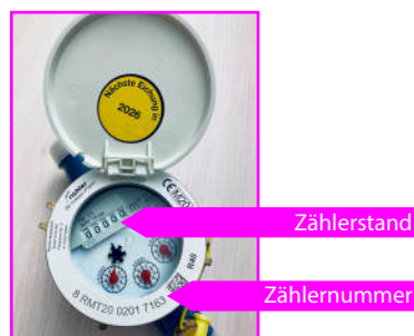
Foto: Wasseruhr mit offenem Deckel

Den Zählerstand lesen Sie bitte vom Rollenzählwerk ab.