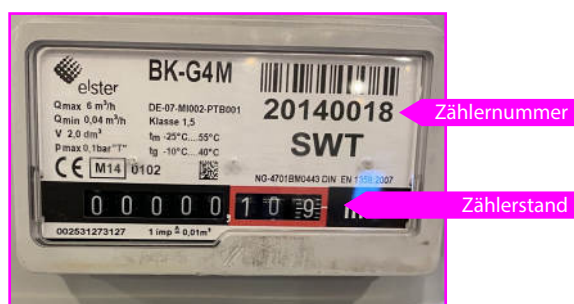
Foto: Analoger Gaszähler

Die Zählernummer des Fernwärmehählers steht direkt unter dem Barcode.