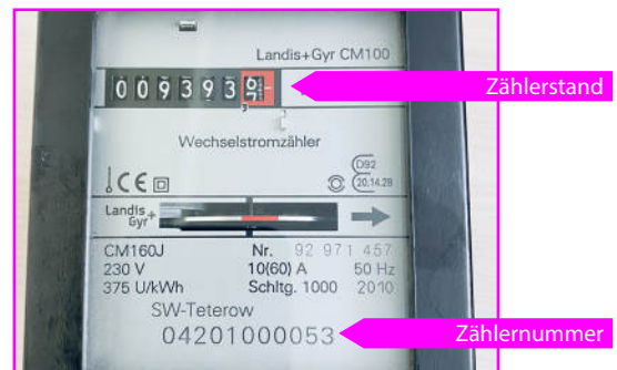
Foto: Analoger Stromzähler

Bei analogen Zählern finden Sie die Zählernummer zumeist unter dem Strichcode Ihres Stromzählers. Hinter dem Glassichtfenster befindet sich ein Rollenzählwerk, von dem aus Sie den Zählerstand ablesen können.