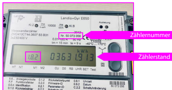
Fotos: digitale Zweitarif-Zähler mit OBIS 1.8.1 und 1.8.2