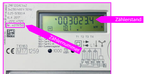
Foto: Digitaler Eintarif-Zähler

Hier notieren Sie bitte den Wert, der Ihnen in der Anzeige rechts neben der OBIS-Kennzahl 1.8.0 oder 1.8.1 angezeigt wird.