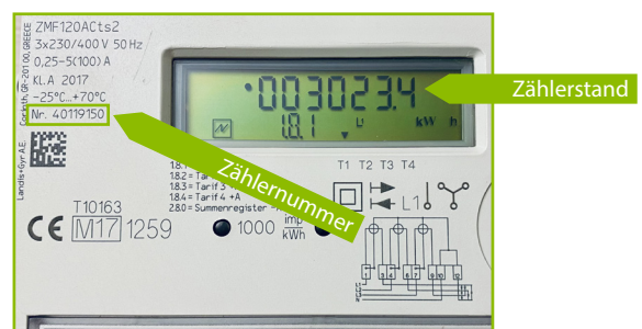
Foto: Digitaler Eintarif-Zähler

Hier notieren Sie bitte den Wert, der Ihnen in der Anzeige rechts neben der OBIS-Kennzahl 1.8.0 oder 1.8.1 angezeigt wird.