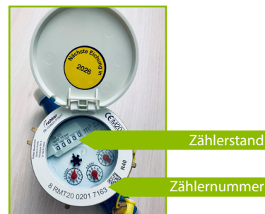
Foto: Wasseruhr mit offenem Deckel

Den Zählerstand lesen Sie bitte vom Rollenzählwerk ab.