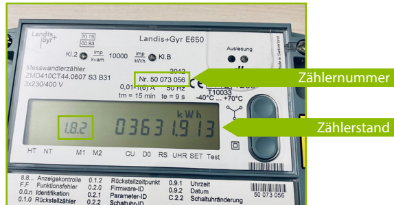
Fotos: digitale Zweitarif-Zähler mit OBIS 1.8.1 und 1.8.2