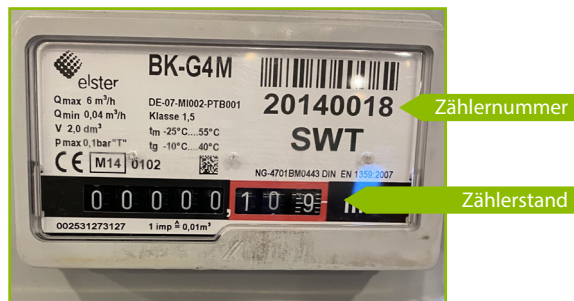
Foto: Analoger Gaszähler

Die Zählernummer des Fernwärmes zählers steht direkt unter dem Barcode.