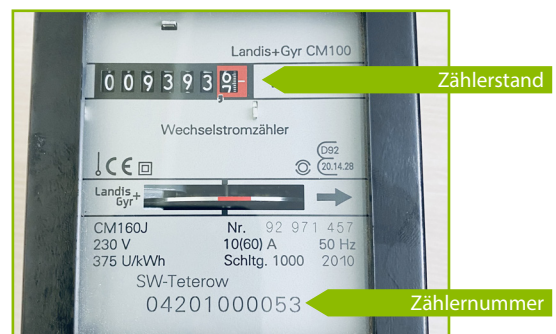
Foto: Analoger Stromzähler

Bei analogen Zählern finden Sie die Zählernummer zumeist unter dem Strichcode Ihres Stromzählers. Hinter dem Glassichtfenster befindet sich ein Rollenzählwerk, von dem aus Sie den Zählerstand ablesen können.